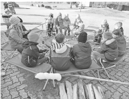
Zum Ausklang gab es Stockbrot und Früchtepunsch